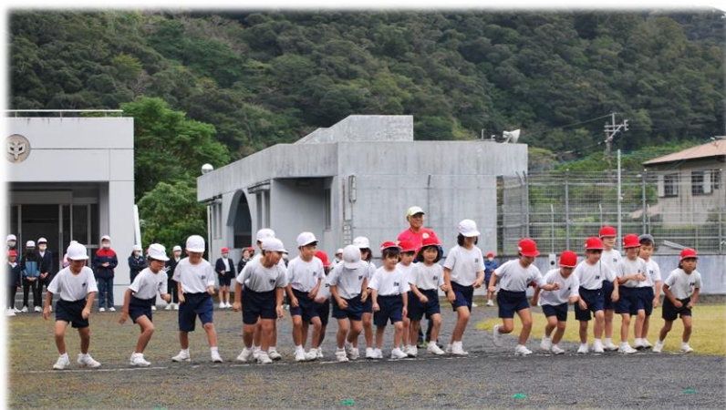
1・2年生のスタートの様子

保護者、そして地域の皆様、全力で頑張る子どもたちへの温かい御声援、本当にありがとうございました。