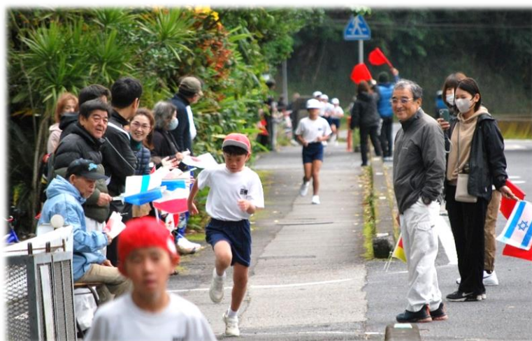
温かい声援を送ってくださった保護者・地域の皆様