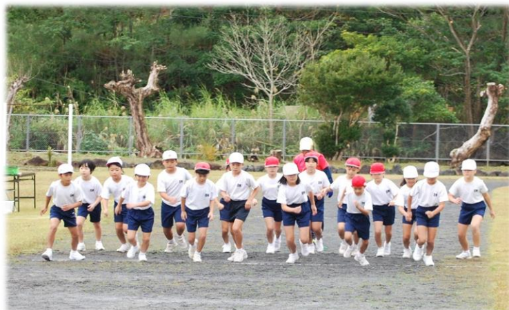
3・4年生のスタートの様子