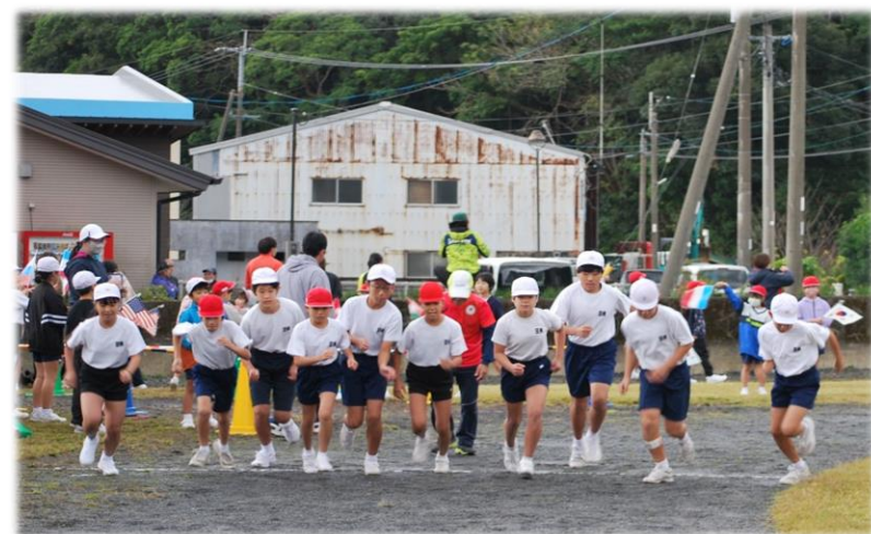
5・6年生のスタートの様子